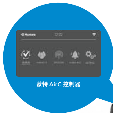
蒙特 AirC 控制器